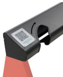
Ejemplo placa personalizada