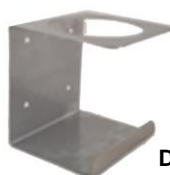
A9170SSS SOPORTE INOX SOBREMESA PARA BOTELLA 80 mm CON DOSIFICADOR PICO-PATO