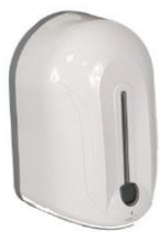
C6630PLW DOSIFICADOR HIGIENIZANTE AUTOMÁTICO