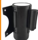
V4110NNR BASE PARED SEPARADOR DE FILAS CON CINTA RETRACTIL ROJA 2,0 m METÁLICO PINTADO