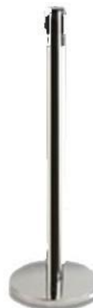
V4020SSB POSTE SEPARADOR DE FILAS CON CINTA RETRACTIL ROJA 3,0 m ACERO INOXIDABLE