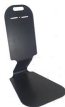
H8510CHP SOPORTE SOBREMESA MOSTRADOR