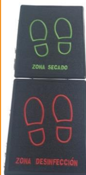
K7020FDZ-E FELPUDO DOBLE HIGIENIZADOR + SECADO PARA SUELAS CALZADO CON RECIPIENTE PARA DESINFECTANTE