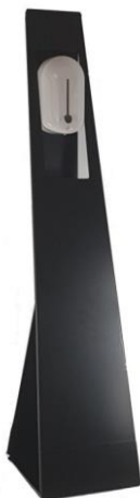
H8512CHP-DA PUNTO HIGIENIZADOR MODELO DELTA (Soporte DELTA + Dosificador automático)