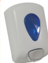
C6030AGB-H DOSIFICADOR JABÓN HIDROALCOHOLICO PULSADOR JAVEA RELLENABLE