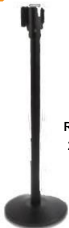
V4010NNR POSTE SEPARADOR DE FILAS CON CINTA RETRACTIL ROJA 2,0 m METÁLICO PINTADO