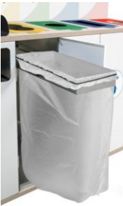
Aro Sujetabolsas extraíble