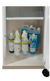
Compartimento productos limpieza *solo en versión líquidos