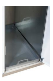
Bandeja de retención líquidos