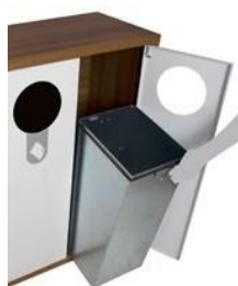
Cubeto metálico interior