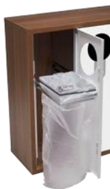
Aro sujetabolsas extraíble