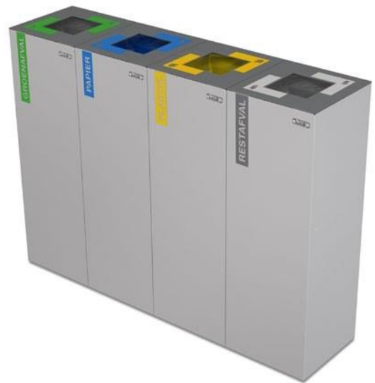
Estación de Reciclaje 4x45l con adhesivas frontales