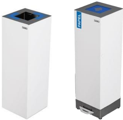
Alicante color Blanco