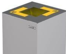
Tapa Abierta (estándar)