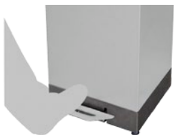
Uso del pedal