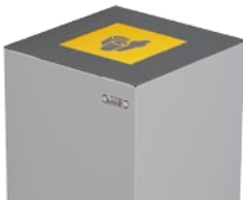
trampilla accionada mediante pedal