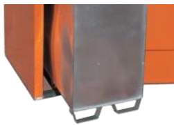
Cuba interior metálica