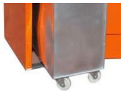
Ruedas para cuba interior metálica