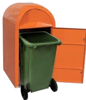
Contenedor interior de plástico (mini)