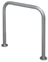
Aparcabicicletas Eindhoven anclable