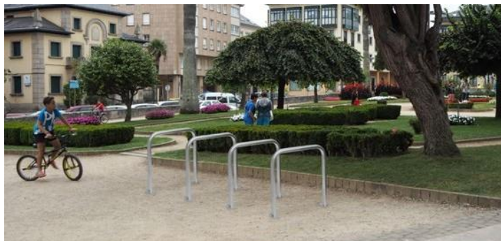
4 Eindhoven en paralelo