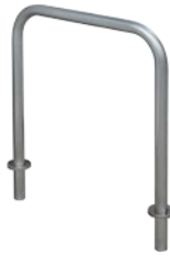
Aparcabicicletas Eindhoven empotrable