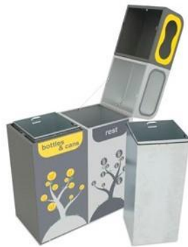
Bruselas Abierta con Cubeto Metálico