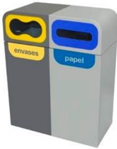
Adhesiva Nombre Residuo