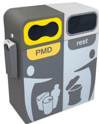
Ceniceros Kaizen 1 l. y Valencia 2 l.