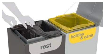
Cubetos interiores con bolsas